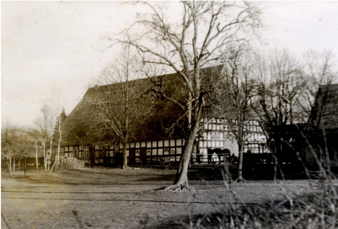
Ein wirklich imposanter alter Baumann-Hof um 1950.

Datum Personen / Ereignisse geboren/getauft verstorben/beerdigt