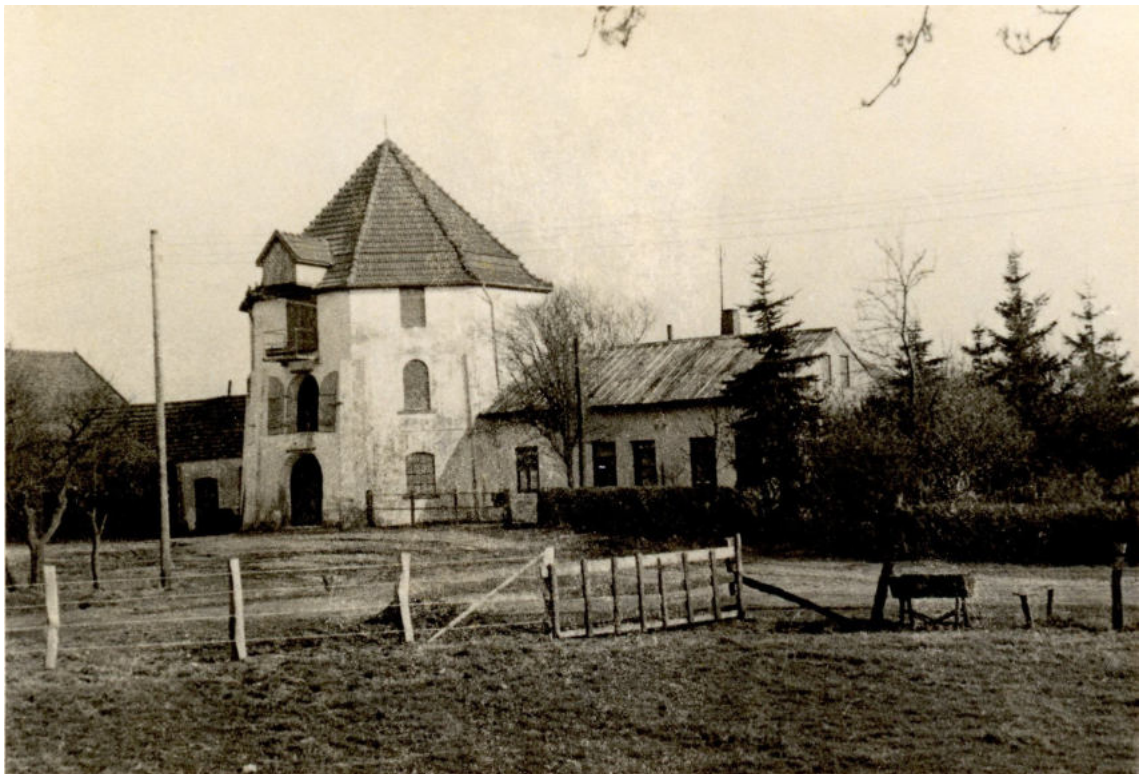
Bild 3: Ansicht der Oyter Mühle um 1950 - sie ist schon lange keine Windmühle mehr.