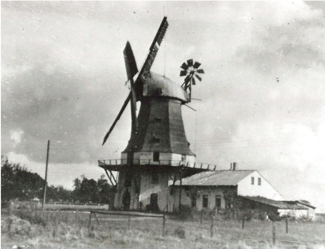
Zum Haupthaus der Baumannstelle liegt derzeit kein Foto vor. Dieses Bild zeigt die um 1856 erbaute Mühle um das Jahr 1900.

Zur Baumannstelle Oyten 6 gehörte als Nebenhaus Nr. 6 f auch eine Windmühle. Sie stand nicht beim Haupthaus, sondern auf einer Anhöhe am Ende des Mühlenwegs, nahe der "Bremen-Harburger Chaussee", heute etwa Mühlenweg 4. Nach der Aufgabe der Baumannstelle wurde sie noch bis 1992 als selbständiger Hof weiter betrieben. Zum Haus Oyten 6 liegt kein Foto vor. Aber es gibt ein paar Fotos von der Mühle.